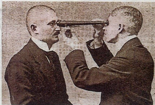
Augenabstandsmessgerät, Firma Busch um 1920.